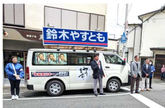
私も伊豆南部で応援演説をさせてもらいました。選挙ハガキの宛名書き、SNSで支持を呼び掛けたり、充実した1ヵ月でした。(稲取の和菓子店「黒初」前)

市や政令区の票が出るにつれ盛り返しました。私もこれまで何度となく選挙を見てきましたが、これだけ票数が拮抗した選挙も珍しいと思います。それだけに両候補とも静岡に対する思いが強いですし、経験を十分に県政に活かせるお二人であつたと思います。